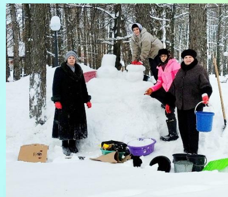
Призёр и номинант денежной премии конкурса «Новогодняя постройка»