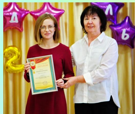
Лауреат конкурса «Воспитатель года 2023»