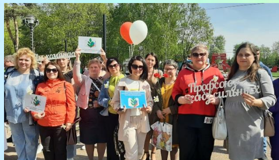
Первомайская маёвка в Скарятинском парке