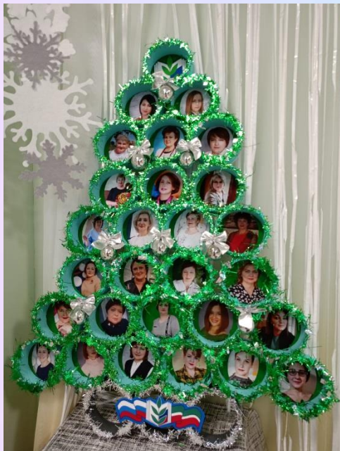
Победитель акции «Профсоюзная ёлочка и номинант комплимента